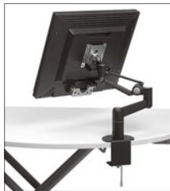
VESA準拠のマウント部に取り付けるディスプレイアームです。